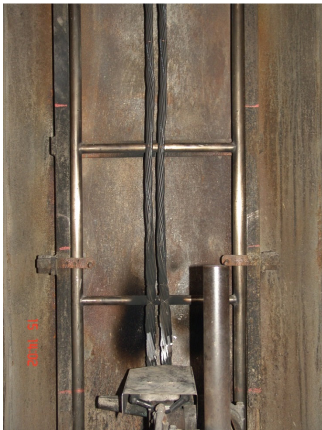
Bild 7: nach Abschalten des Brenners Figure 7: after extinguishment of the burner